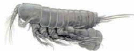
Nitocra Spinipes är en salttålig sexuell räka som använts vid ekotoxförsöken med askor.

ekotoxiska effekter av makroelement vid avfallsklassificering av askor. Samt Värmeforskprojekt 1208 2012 Askor – långsiktiga ekologiska miljörisker. Ö Wik, M Breitholz, K Hemström, M Linde, S Stiernström, A Enell