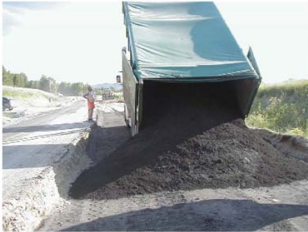
Bilder från Rv 90 och Ålandtippen (blandning)