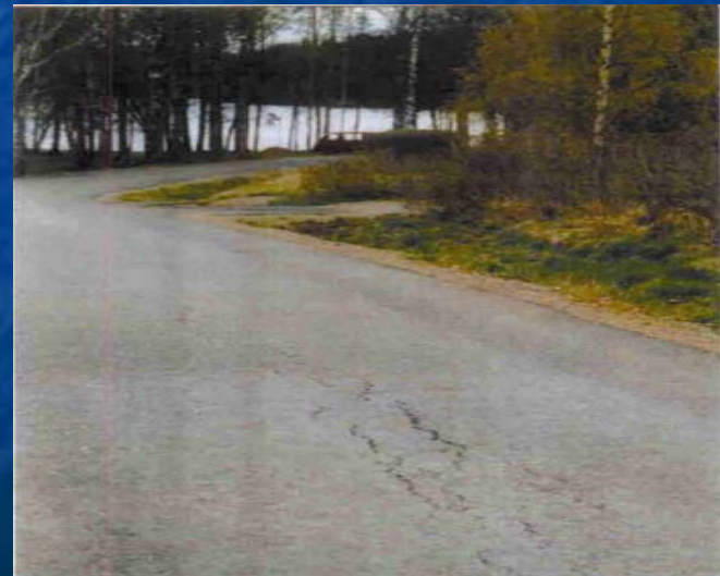
Referensväg renoverad på traditionellet sätt fick sprickor redan efter 1 år