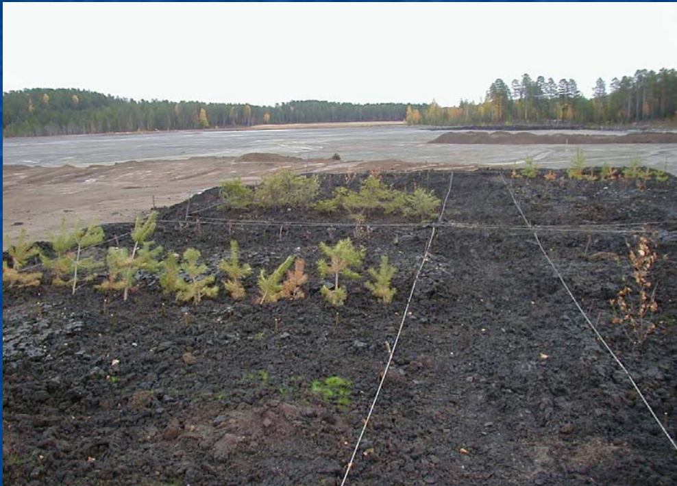
Bolidens sandmagasin Gillervattnet

Mycket stor potentiell marknad för flygaskor