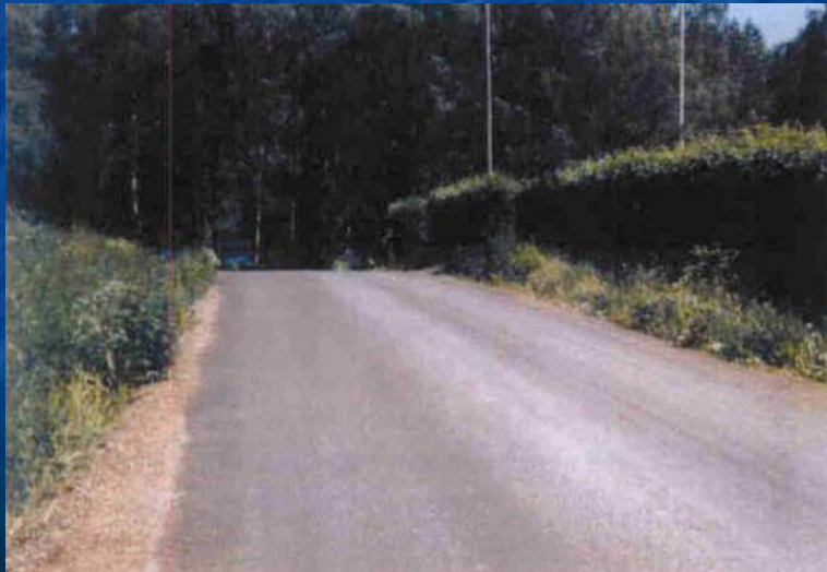
Väg med flygaska ca 7 år efter renovering Askan höll 5 % cement samt även fiberslam